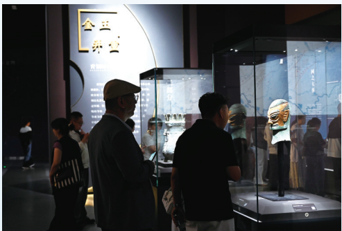
图为观众在看三星堆的“戴金面罩青铜人头像”。