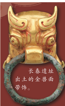
长春遗址出土的金兽面带饰。

“那些深埋地下的墓葬、作坊、沟渠与器物,是三千年前周人生活的鲜活遗存,更见证了西周王朝以礼治国、分封治理与文化辐射的完整进程,为探源中华文明发展脉络增添新的考古实证。”种建荣说。(记者:杨一苗、张思洁) 来源:新华社