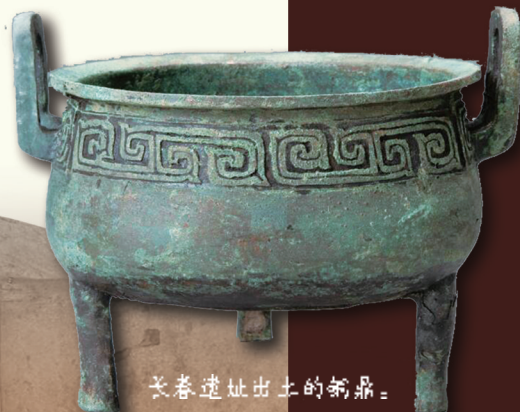
长春遗址出土的新鼎。