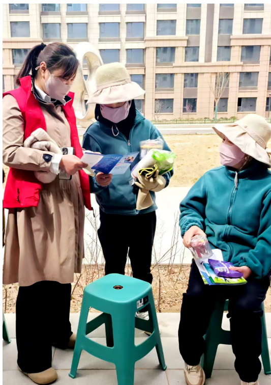
活动现场群众体验。