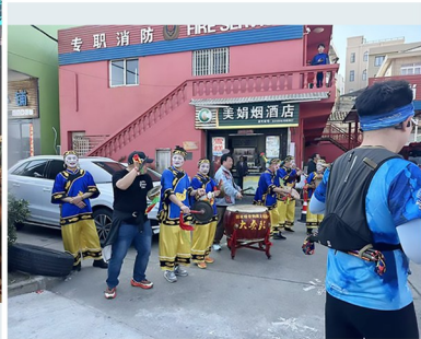
2025 温岭黄金海岸跑山赛比赛现场。