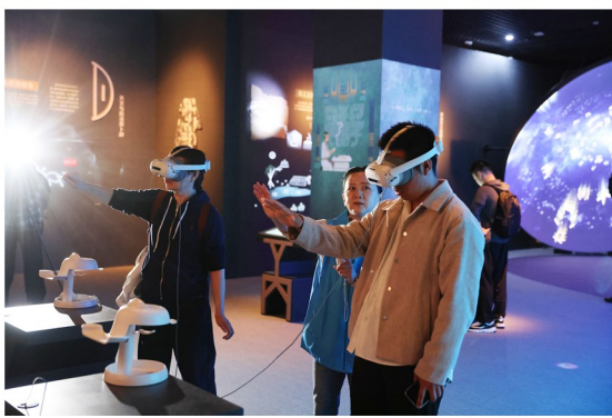
观众在展览上佩戴专业眼镜体验甲骨制作全流程工艺。