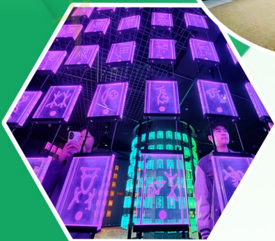
观众在展览上参观。

据介绍,本次展览是“天津博物馆甲骨数字化保护项目”在线下展厅的落地转化成果,将持续展出至10月中旬。“我们要让数字保护成果更好地普及于民,惠及于民,让广大观众借助科技赋能,真切感受到传统文化活在当下的蓬勃力量。”天津博物馆馆长姚旻说。(记者:周润健 徐思钰) 来源:新华社