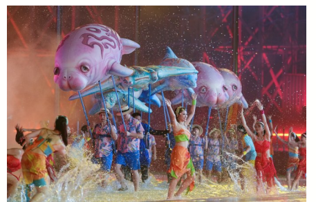
4月22日,演员在开幕式上表演。