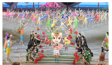
4月22日,吉祥物坡鹿“亚亚”形象出现在开幕式表演中。