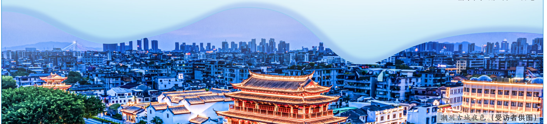
潮州古城夜色。