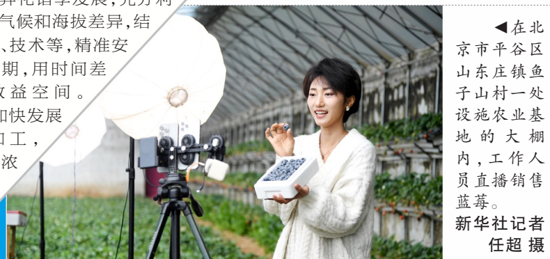
▲在北京市平谷区山东庄镇鱼子山村一处设施农业基地的大棚内,工作人员直播销售蓝莓。