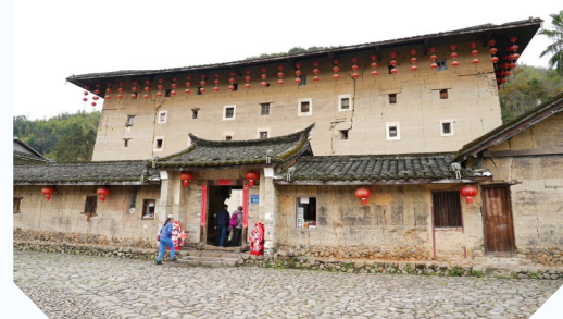
位于福建省南靖县梅林镇的方形土楼和贵楼。