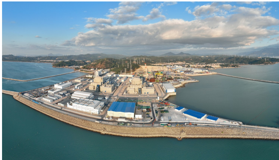
建设中的漳州核电项目。