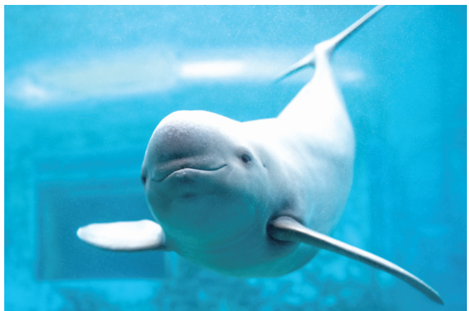
一头长江江豚在水中游动。

“将长江江豚确定为城市吉祥物,是以法治方式巩固长江大保护成效、弘扬长江文化的重要举措。”武汉市人大农业与农村委员会相关负责人表示,未来将支持科研机构开展繁育与栖息地研究,构建全民共治保护格局,在重大活动、对外交往、文旅融合等领域,充分释放城市吉祥物的文化价值、生态价值和社会价值。