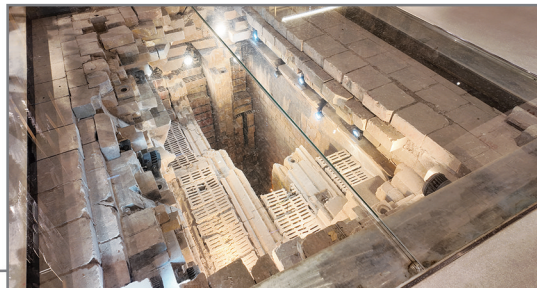
1月26日,在“杭钢记忆——杭州大运河杭钢公园历史文化摄影展”里,焦炉展厅还保留了由榫卯结构砌筑而成的耐火砖。