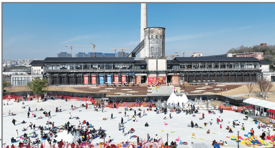
1月9日,位于浙江杭州的大运河杭钢公园开启冰雪嘉年华,近万平方米冰雪世界吸引市民前来游玩。