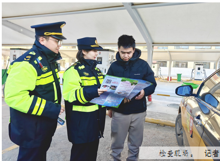
检查现场。