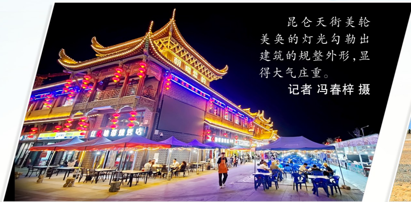
昆仑天街美轮美奂的灯光勾勒出建筑的规整外形，显得大气庄重。