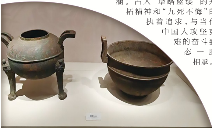
▲安徽淮南武王墩考古现场临时展馆里展出的青铜器。 新华社记者 余俊杰 摄

从武王墩考古现场出发，网络文学的旅程连接着过去、现在与未来。它深入挖掘并创新表达中华文明的精神标识，生动记录并礼赞民族复兴的时代征程，更自信地将当代中国价值寓于精彩故事，推向世界舞台。来源：新华社