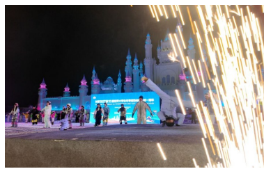
▲1月15日，长春2027第33届世界大学生冬季运动会倒计时一周年活动现场。