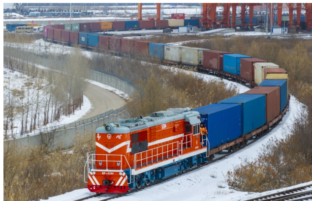
二月六日，一列中欧班列驶出中国铁路哈尔滨局集团有限公司江北站换装场（无人机照片）。

以科技创新为引领，新质生产力发展蹄疾步稳。税收发票数据显示，今年前11个月，创新产业加快发展，全国高技术产业销售收入同比增长14.7%；数实融合不断推进，全国企业采购数字技术金额同比增长10.2%；传