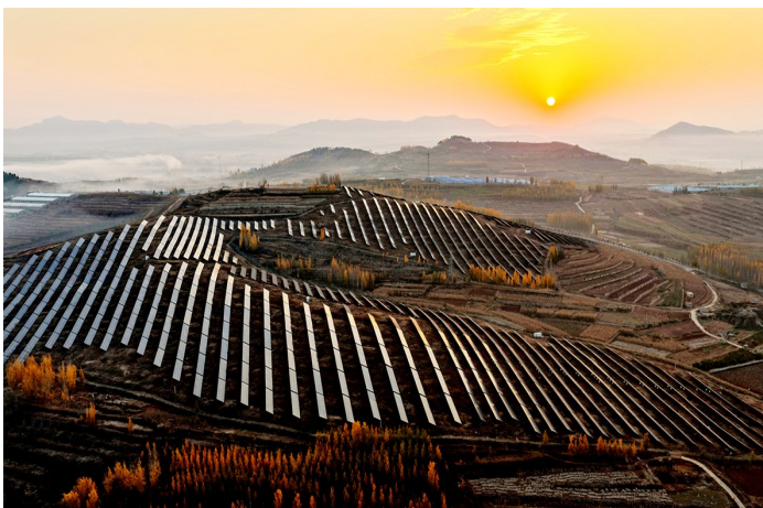
阴县常路镇东三庄光伏基地（无人机照片）。 二月二日拍摄的临沂市蒙

“一升一降”反映我国能源结构绿色转型加快推进。今年前11个月，风力发电、太阳能发电销售收入分别增长16.8%和35.7%，而火力发电销售收入同比下降7.2%，占全国电力行业销售收入比重下降4.7个百分点。