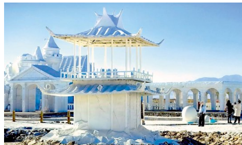
步入冬季,茶卡盐湖·天空之镜,展现出如诗如画的美景,湛蓝的天空、平静的湖水和形态各异的雕塑构成一幅绝美的自然画卷,吸引许多游客前来打卡,尽情享受这宁静而浪漫的冬日美景。