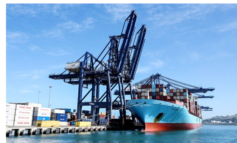
这是11月18日在智利圣安东尼奥港拍摄的服务于“车厘子快线”的货轮。