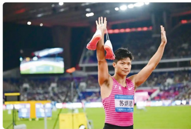
▲11月20日,广东队选手苏炳添在比赛后向观众致意。