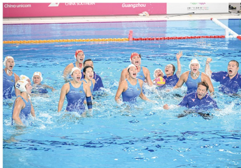
▲11月21日,亚军天津队在颁奖仪式中。

当日,第十五届全国运动会女子水球比赛在广州落幕,上海队12比6战胜天津队,夺得金牌。