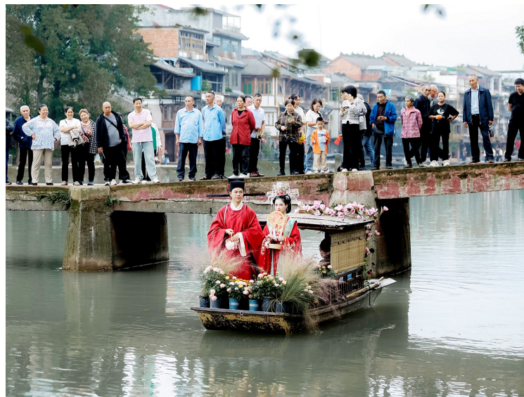
国庆节期间，成都邛崃市夹关古镇举行的水上婚礼仪式。

今年7月，上海51家相关企业共同筹备成立了“上海虹口甜蜜产业发展联合会”。联合会相关负责人表示，将整合产业链上下游资源，推动婚庆服务与文旅体验、餐饮住宿、金融服务等领域深度融合，不断提升产业发展能级。 新华社北京11月3日电