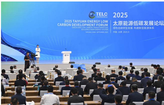
左图：9月27日拍摄的2025年太原能源低碳发展论坛开幕式现场；右图：9月27日，观众在2025年山西（太原）能源产业博览会上参观。

“绿色能源对当今的发展具有非常重要的意义，我来自最不发达国家，我们正遭受着全球变化的影响。加快绿色转