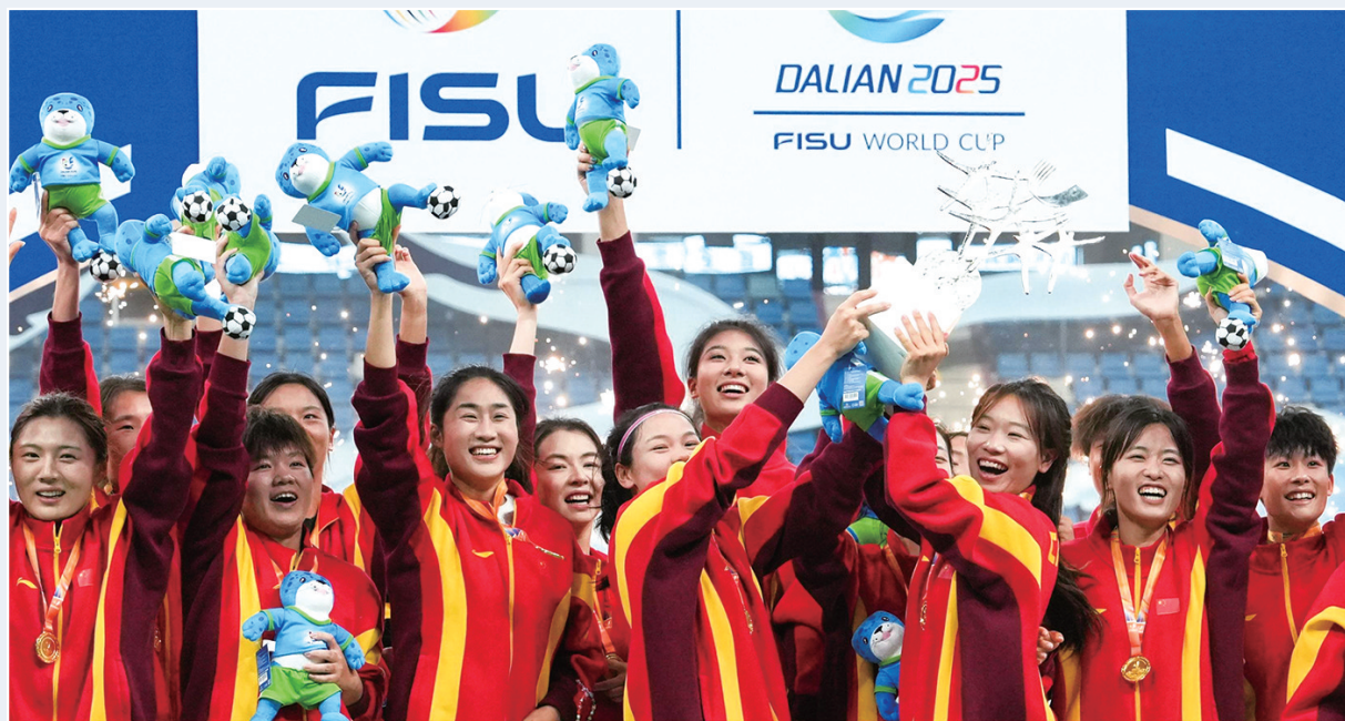
9月27日,冠军上海体育大学女足成员在颁奖仪式上。

当日,在大连举行的2025年国际大体联足球世界杯女足决赛中,中国上海体育大学女足3比1战胜加拿大拉瓦尔大学女足,夺得冠军。