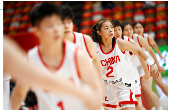
▲9月18日,中国队球员在比赛前热身。

北京体育大学转训至9月30日。宫鲁鸣表示,接下来的主要任务是提高运动员的基本功和个人能力,逐渐形成新一届中国女篮的风格。