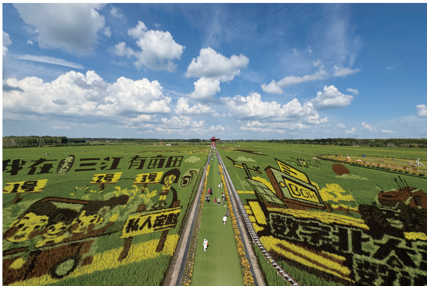
这是位于北大荒集团闫家岗农场有限公司的稻田画。