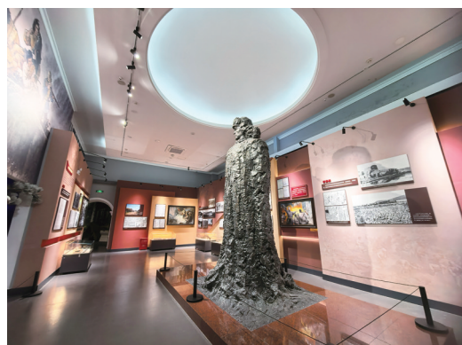
这是东北烈士纪念馆内的杨靖宇将军雕像。

军纪念馆，赵尚志、赵一曼烈士纪念馆，以及靖宇街、尚志大街、兆麟街、一曼街等以英雄名字命名的街道，无一不表达着这座城市对革命先烈的纪念。朱占春说，游客们可以跟着即将上映的电影《731》的镜头，走进侵华日军第七三一部队罪证陈列馆，去触摸那段不容忘却的历史。