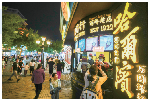
人们在哈尔滨中央大街上购买美食。