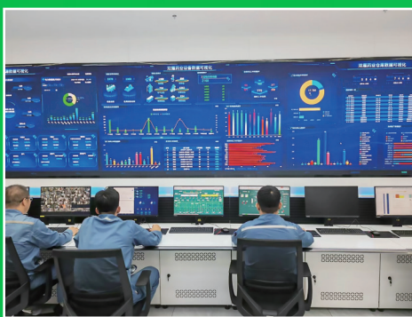
2025年8月23日,中联数据集团山西公司工作人员在操作电子平台。