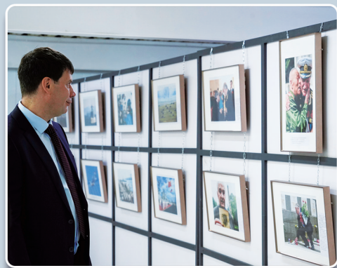
8月28日，在俄罗斯圣彼得堡，一名男子参观纪念中国人民抗日战争暨世界反法西斯战争胜利80周年图片展。