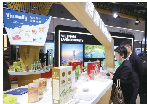
11月6日，参观者在第六届进博会国家展越南展台挑选商品。