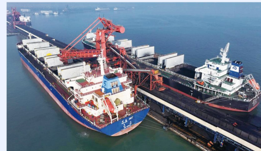
日前,两艘轮船靠泊在唐山港曹妃甸港区国投曹妃甸港口有限公司煤炭码头装货。