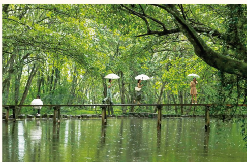
游客们在黄山市徽州区西溪南古村内游览。