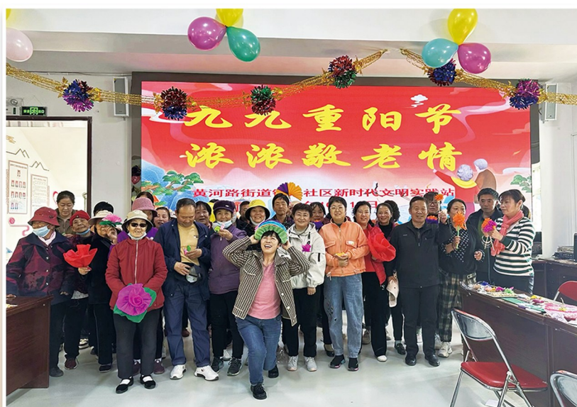
博爱巷社区(左图)、铁东社区工作人员组织辖区老人开展敬老活动。