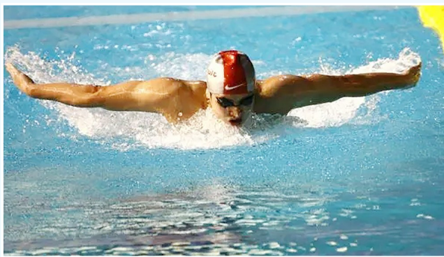
2007年3月28日，中国选手吴鹏在第12届世界游泳锦标赛男子200米蝶泳决赛中以1分55秒13的成绩获得银牌。