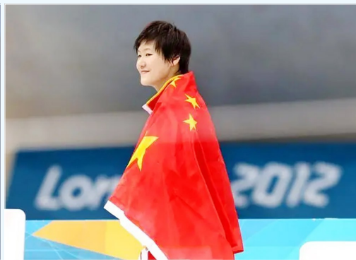
2012年7月31日，冠军叶诗文在伦敦奥运会女子200米个人混合泳颁奖仪式后身披国旗离场。