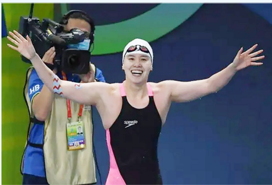
2021年9月20日，浙江队选手傅园慧在第十四届全运会游泳项目女子100米仰泳半决赛中。