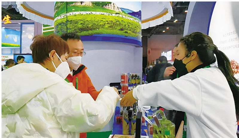
因为工作人员向采购商推介海西绿色有机农畜产品。