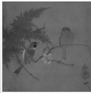
宋徽宗《腊梅双禽图》