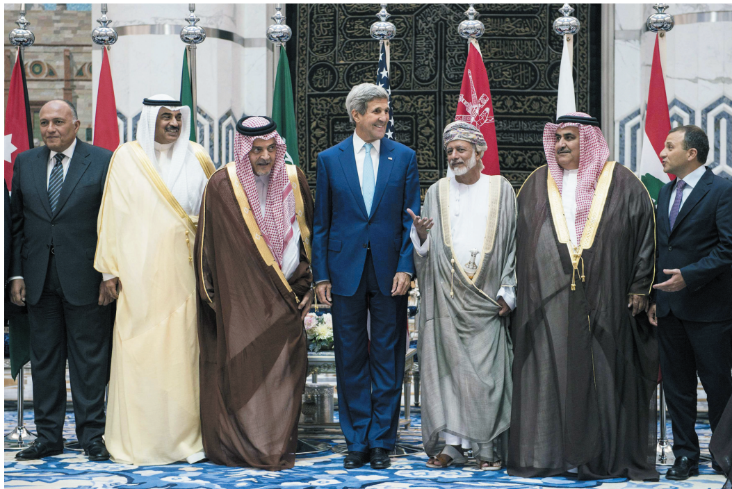
9月11日,在沙特阿拉伯吉达,(左起)埃及外交部长舒凯里、科威特副首相兼外交大臣萨巴赫、沙特阿拉伯外交大臣费萨尔、美国国务卿克里、阿曼外交大臣优素福、巴林外交大臣哈立德、黎巴嫩外交部长巴西勒一起合影。

美国与10个阿拉伯国家11日一致同意,将采取协调行动,对抗地区极端组织给周边国家乃至更大区域带来的威胁。美国国务卿克里以及来自沙特、伊拉克、埃及、约旦、黎巴嫩、科威特、阿联酋、卡塔尔、阿曼和巴林10个阿拉伯国家的外长当天在沙特西部沿海城市吉达召开会议,此次会议旨在建立广泛联盟打击极端组织“伊斯兰国”。土耳其外长也参加了当天的会议。